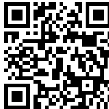
QR code Morsetekens

Het gemakkelijkste kan dat door de bijgaande QR-code met je telefoon te lezen. Die stuurt je meteen naar onze webstek waar je kunt kiezen uit betalen met iDeal of Paypal. Doe je het liever op de ouderwetse manier? Dat kan ook, het IBAN is NL19 SNSB 0787 8562 23 en de begunstigde de Stichting Vrienden van Morsetekens te Leiden.