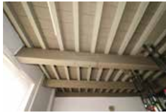
Balklaag links Telmerk rechts

bij nemen want de nauwkeurigheid van dergelijke tekeningen laat te wensen over. Verder vond hij achter de koepel en de voormalige wagenschuur bakstenen die op basis van type en formaat als ook de wijze van metselen als typisch 17de-eeuws gedateerd kunnen worden. Verder is er aan de noordzijde van het voormalige woonhuis een opkamer met daaronder een kelder; daar zijn nog zogenoemde kruisgewelven.